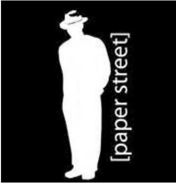
Teatro Vascello, Roma - 17 marzo 2015